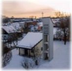
Bruder Konrad Kapelle Hammerles

der Pfarrei Parkstein mit Expositur Kirchendemenreuth