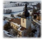
St. Johannes der Täufer Kirchendemenreuth