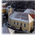
St. Pankratius Parkstein